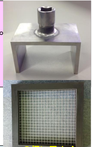
SUSの振り用メッシュ